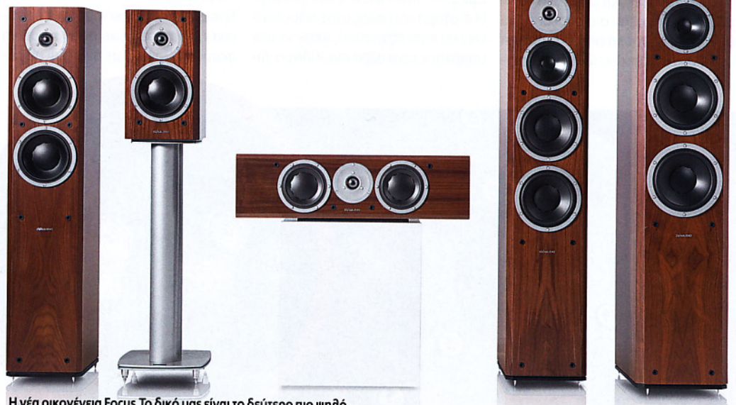
Η νέα οικογένεια Focus. Το δικό μας είναι το δεύτερο πιο ψηλό.

Δεν είναι ο ήχος του 2012, αλλά ο φυσικός ήχος που τόσο μας έχει λείψει τα τελευταία χρόνια. Ένα ήρεμο και εύκολο ηχείο με διάθεση και πιστότητα, ικανό να μας ταξιδέψει αβίαστα στη μαγεία της μουσικής όπως αυτή υπάρχει στο μυαλό μας.